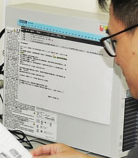
治安組 指紋辨識畫面 (1)