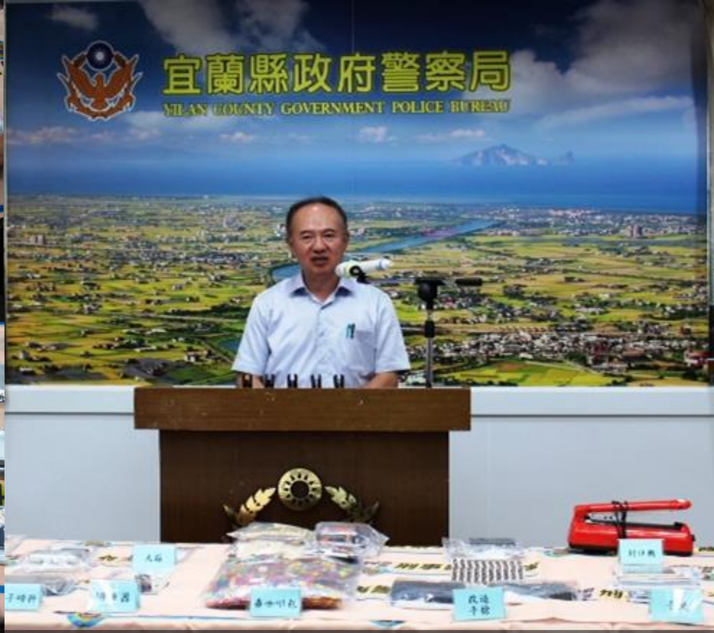
治安組 掌握調驗人口動態、有效防制毒品再犯(2)