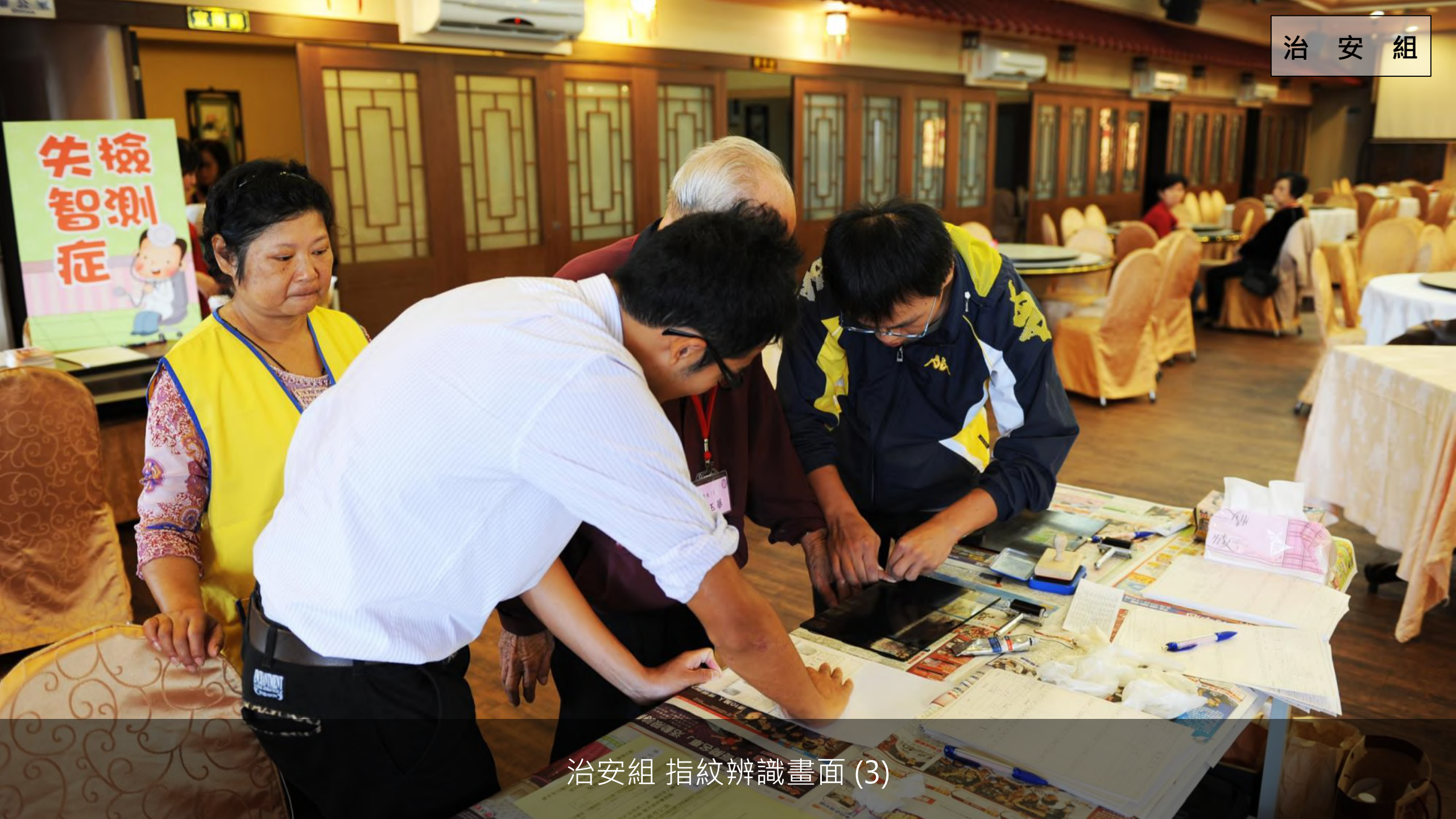
治安組 指紋辨識畫面 (3)