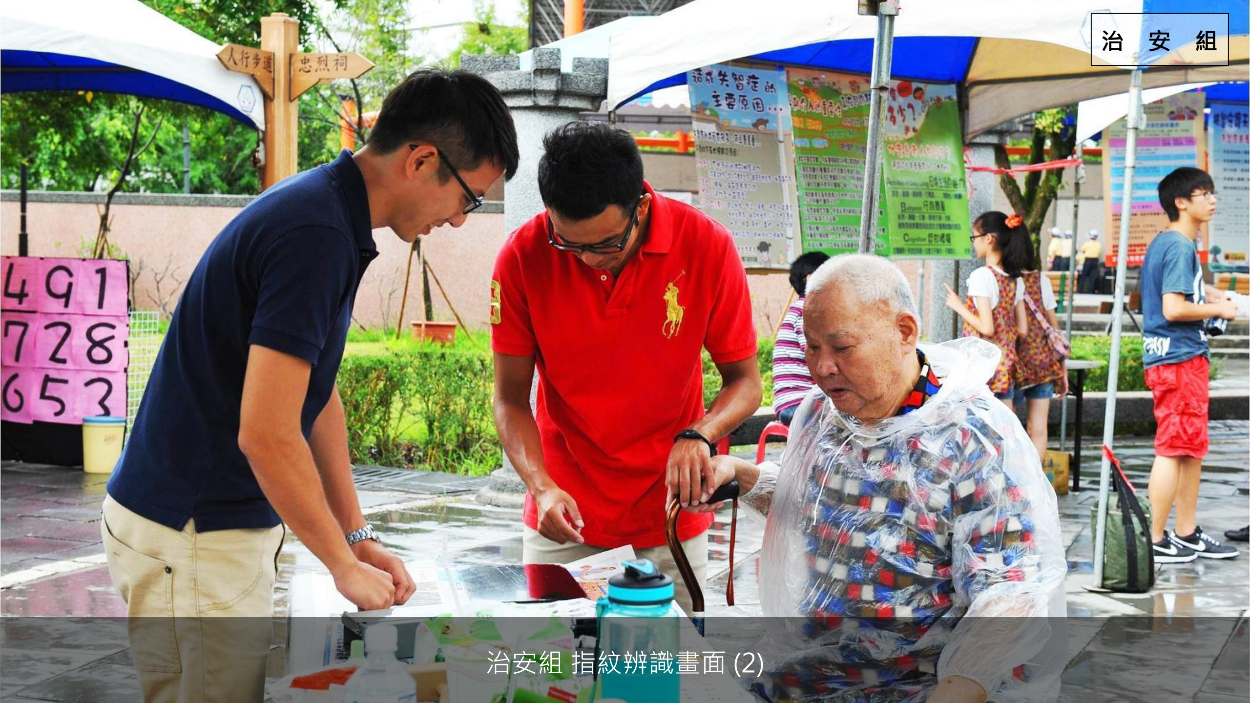
治安組 指紋辨識畫面 (2)