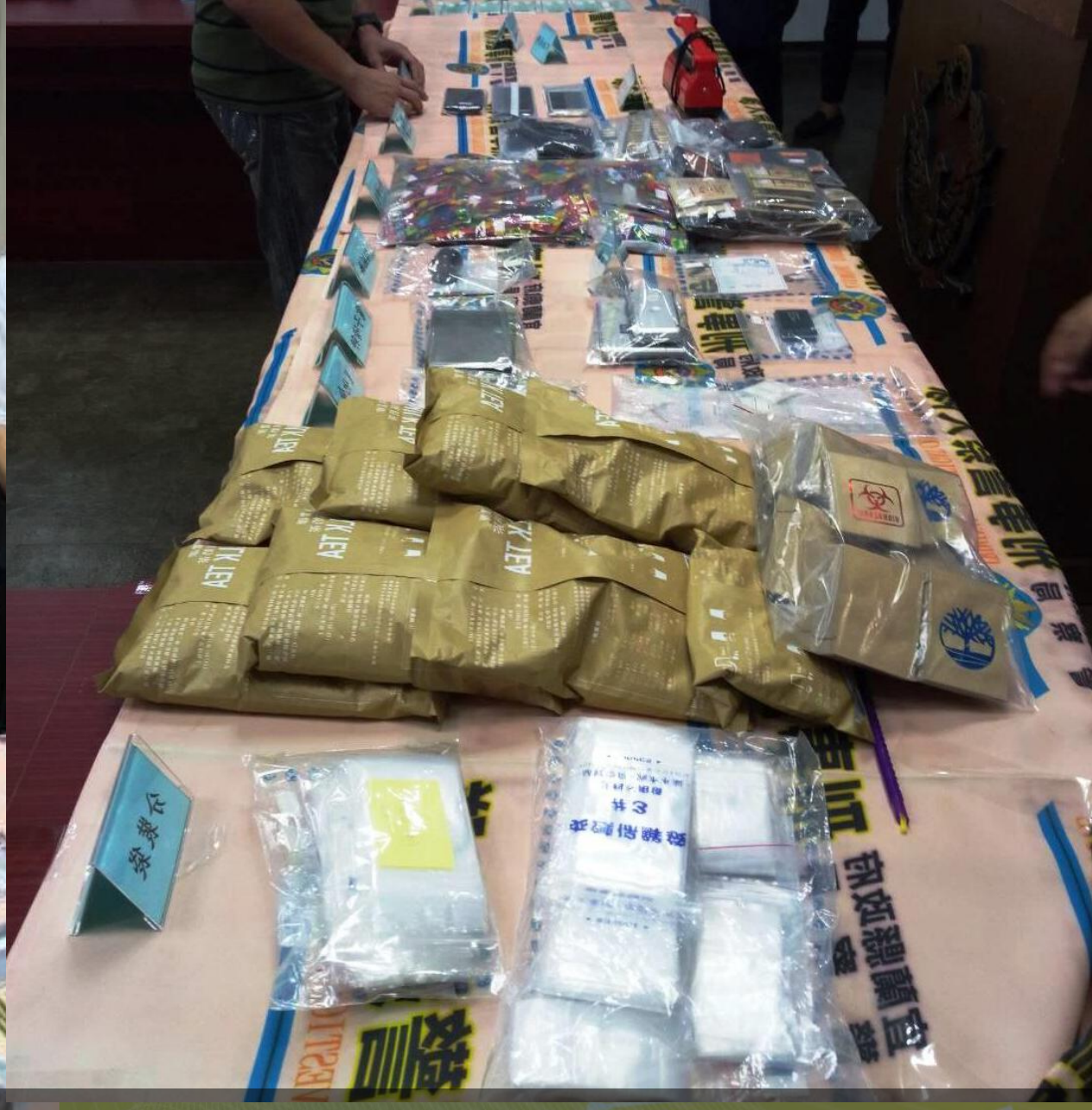
治安組 掌握調驗人口動態、有效防制毒品再犯(1)